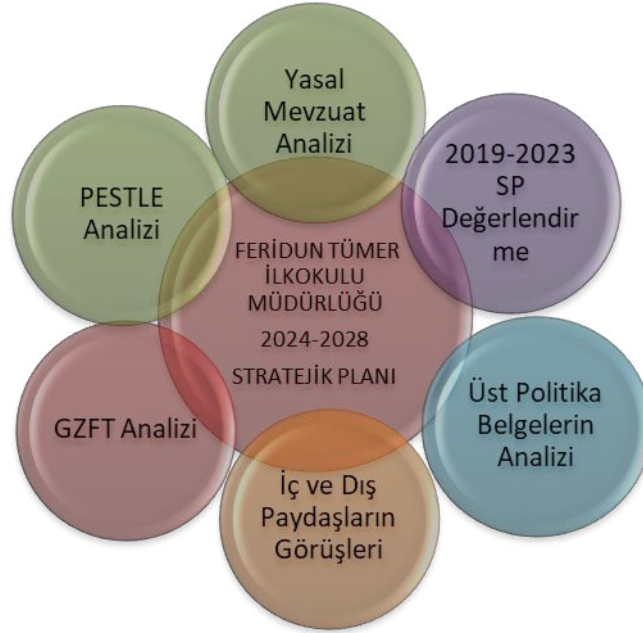
Şekil 2: Stratejik Plan Hazırlık Çalışmaları